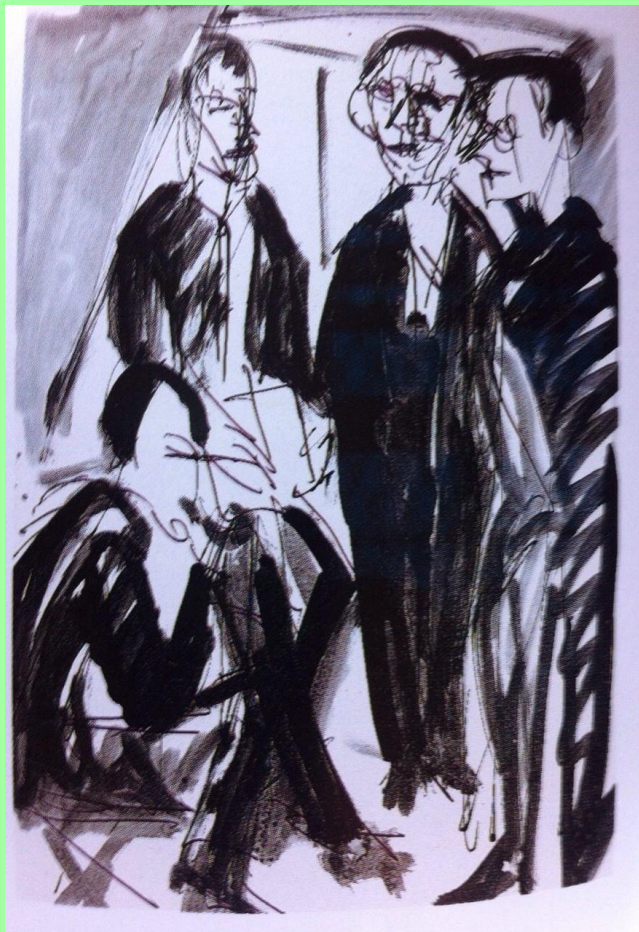
EL PUENTE Die BRUCKE kirchner 1912