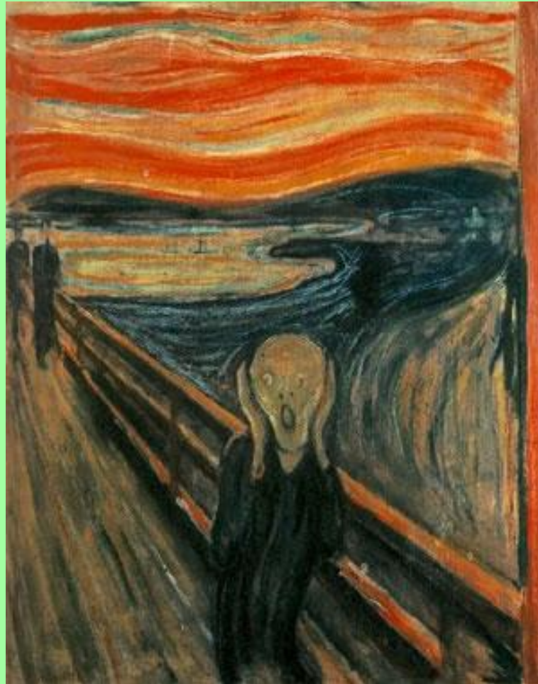
EL GRITO Munch 1893